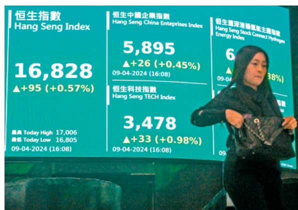
▲港股昨日一度衝上萬七關，惜承接力不足，收市報16828點。

個別股份昨日出現斷崖式下滑，天瑞水泥（01252）股價跌99%，報0.048元；浩森金融（03848）跌90.9%，報0.53元。昇能集團（02459）跌49.8%，報2.1元；中木國際（01822）股價跌45.5%，報0.085元。