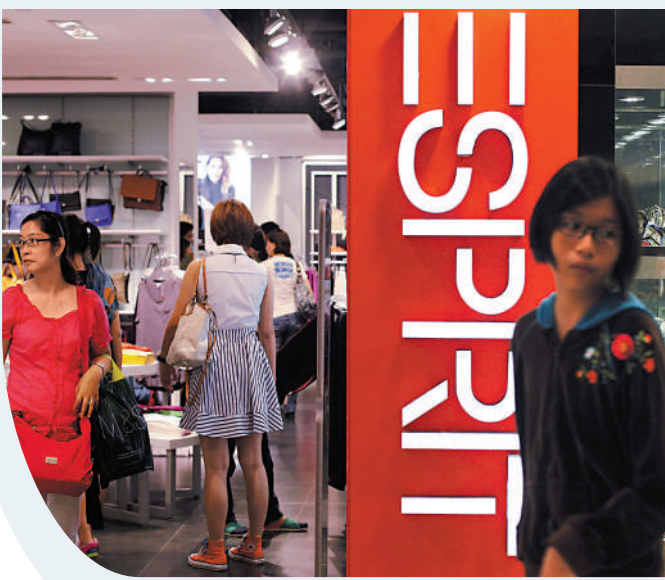
▲2020年，思捷宣布關閉亞洲56間零售店。圖為ESPRIT以往在新加坡的分店。