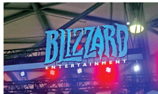
▲網易與暴雪之前的授權協議於去年1月到期，導致多款暴雪國服遊戲停運。

另外，是次批出遊戲還包括於2018年在海外發售的「寶可夢 走吧！伊布」，以及2019年正式推出的「刺蝟索尼克團隊賽車」。