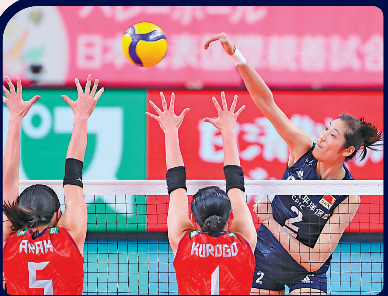
▲朱婷（右）是中國女排主力。