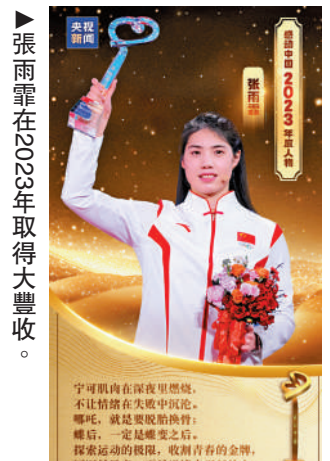
▲張雨霏在2023年取得大豐收。

此前接受採訪時，張雨霏給自己2023年的表現打出95分。談及未來的目標，張雨霏坦言，巴黎奧運會是龍年的「重頭戲」，她希望把2023年的狀態延續到巴黎奧運上，也希望超越自己在東京奧運（2金2銀）取得的成績。