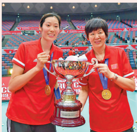
▲朱婷（左）與恩師郎平合照。

據中新社報道：北京時間8日晚，正在跟隨球會征戰意大利女排甲級聯賽的中國名將朱婷，通過個人社交平台賬號宣布，她已正式與中國排球協會確認，將在世界女排聯賽期間回歸國家隊。朱婷表示，此次歸隊唯一目的是為中國女排奪取巴黎奧運會參賽資格盡一份力。她強調，為避免一切干擾和誤解，在國家隊期間不參加任何商業活動，不接任何商業代言合作。