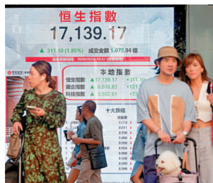
▲證券界人士相信，港股有望延續反覆慢牛向上勢頭。

另外，大摩最新推介具備財息兼收(Enhanced Dividend)的股份，包括中電、中行、招行(03968)、長建(01038)、電能(00006)等。大摩稱，市場關注美國經濟「不着陸」和「通脹黏性」，情況有利於收息股跑贏大市。此外，國家有關部門採取措施鼓勵企業提高股息派發，這將利好收息股的估值修復。