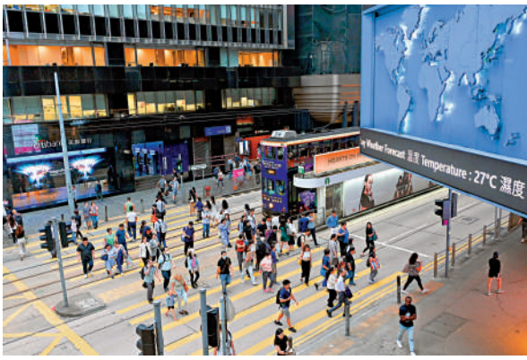
▲香港是國際資產及財富管理中心，同時家族辦公室業務迅速發展。

【大公報訊】為吸引更多投資者來港，特區政府在今年財政預算案中，宣布將進一步優化有關基金、單一家族辦公室及附帶權益的優惠稅制。外電昨日引述消息指，特區政府擬推出諮詢文件，將包括私人信貸及基礎設施在內的受歡迎另類投資工具，提供更優惠的稅務待遇，預計文件最快於本月出。