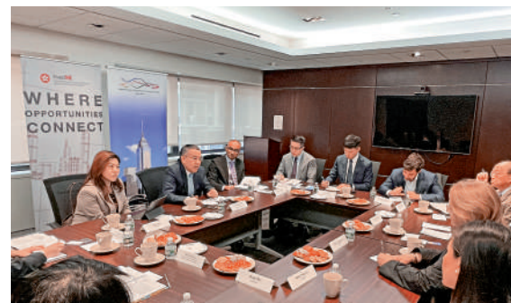
▲財庫局局長許正宇（左二）在紐約參與有關香港金融科技發展的圓桌討論。

許正宇還提到，香港將在9月舉辦「一帶一路」稅收徵管合作論壇，提供平台讓來自各國政