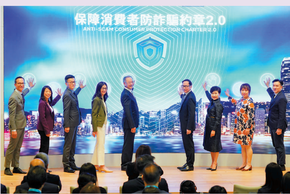
▲金管局總裁余偉文（左五）聯同銀行公會、警務處、積金局等代表參與《保障消費者防詐騙約章2.0》活動儀式。

出席同一場合的香港警務處網絡安全及科技罪案調查科總警司林焯豪表示，轉數快可疑識別代號警示「成效清晰」，去年11月底推出至今年3月左右，系統共發出大約50.5萬個警示，攔截懷疑有問題的騙款金額達6億元。對於部分市民漠視警示訊息，他說會與銀行公會商討對策，冀有助用戶提高警覺。