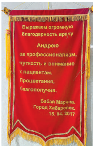
俄羅斯患者為中國醫生送來錦旗。

「來我院治療的俄羅斯患者多為50歲至80歲的俄羅斯中老年人，主要治療心腦血管疾病、老年性風濕骨病，以及做種植牙還有整容。」安玉子介紹，醫院熱門科室都配備專業的醫療翻譯人才，「醫療無小事，所以就是一位專門的懂得醫療專業知識的翻譯工作人員，首先就是要求會俄語，其次他還要懂醫學，具備相關從業資格。」