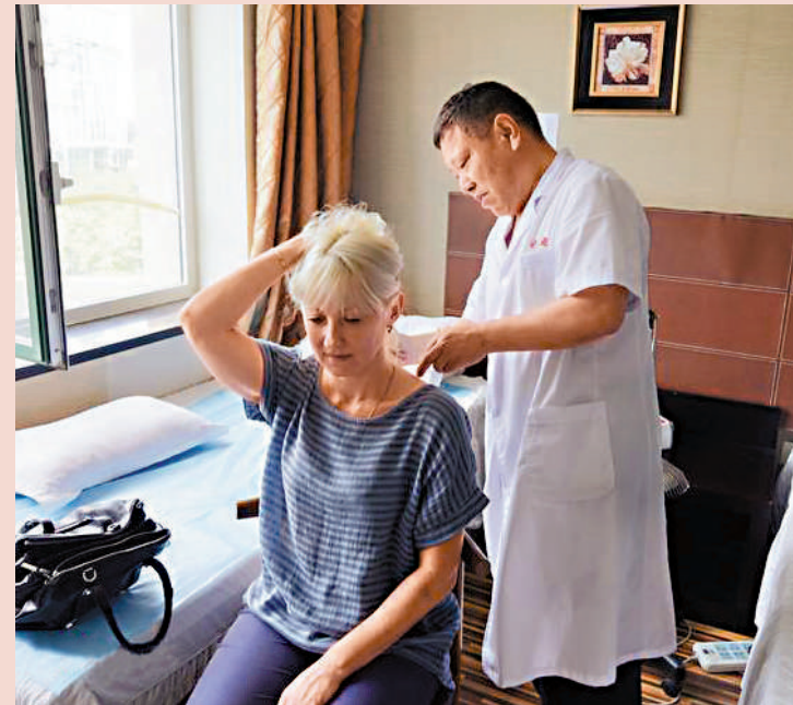
中國中醫師為俄羅斯患者緩解肩頸疼痛。網絡圖片