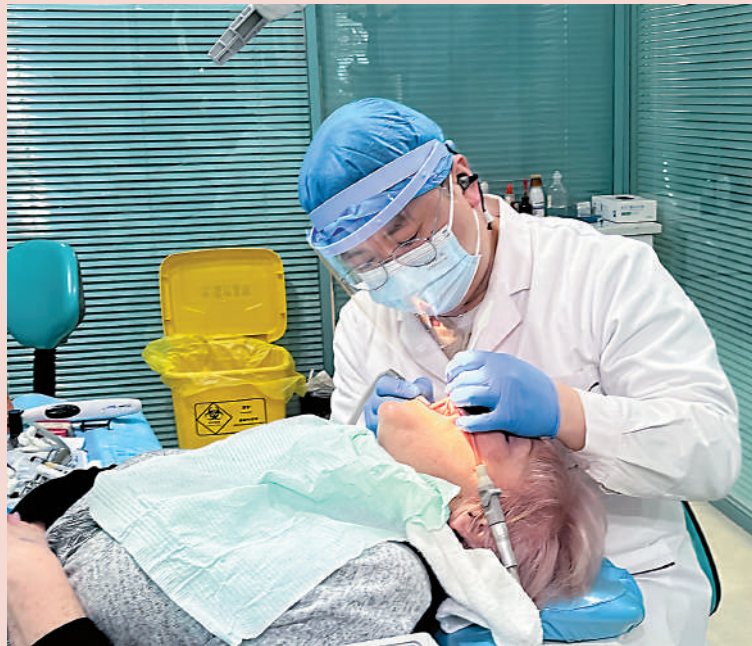
琿春歐亞醫院醫生為俄羅斯患者護理牙齒。