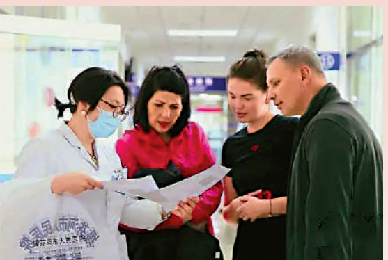
黑龍江省綏芬河市醫生為俄羅斯患者講解檢查報告。