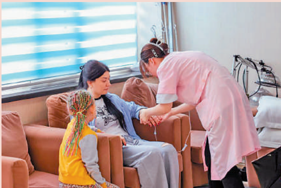
琿春一醫院的護士為俄羅斯患者輸液。