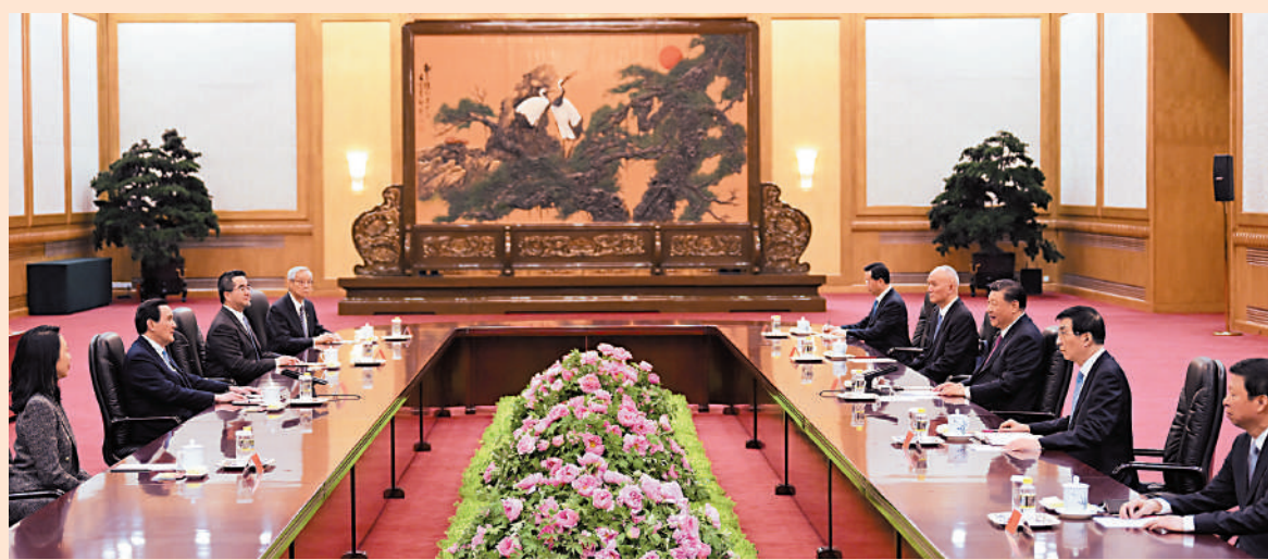
▲4月10日下午，中共中央總書記習近平在北京會見馬英九一行。

守護中華民族共同家園，共同追求和平統一的美好未來，把中華民族的命運牢牢掌握在中國人自己手中。