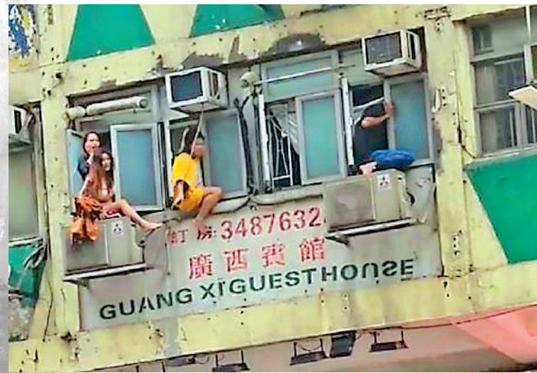
▲住客逃生無門，危坐窗邊求救，險象環生。