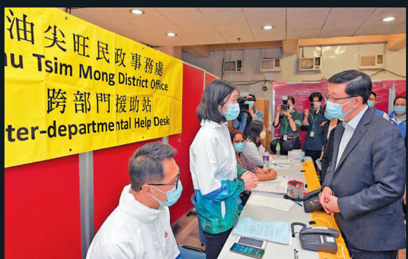
▲李家超視察醫院內的跨部門援助站。