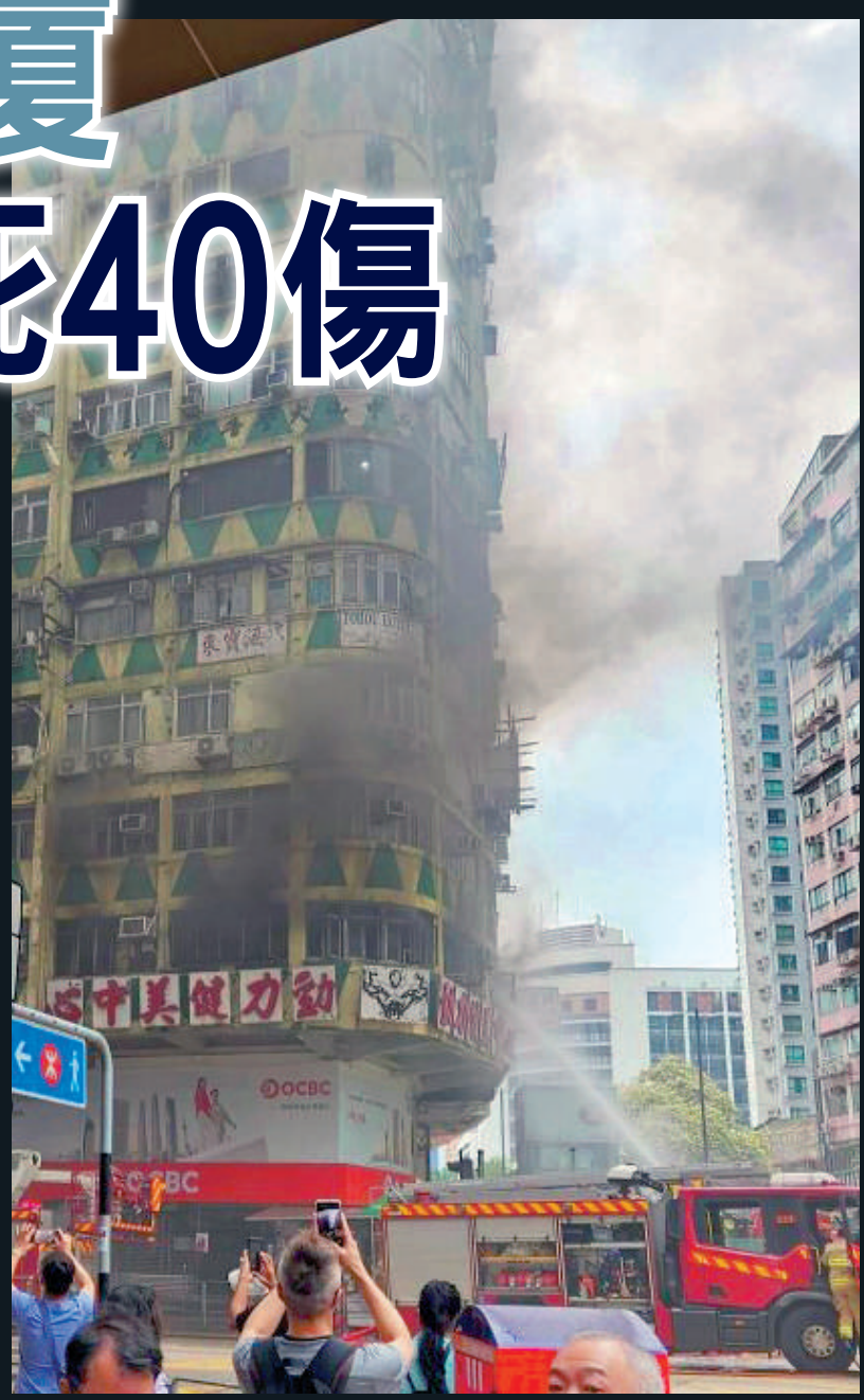
▲佐敦華豐大廈昨日發生三級大火，冒出大量濃煙。

屋宇署表示，非常關注佐敦華豐大廈發生的嚴重火警，昨日下午已在消防處協助下，進入大廈公用地方及部分私人單位視察，發現當中有部分結構因火警受破損，但整體樓宇結構沒有明顯危險。署方會全力配合消防處的調查工作。