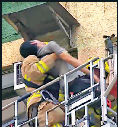
▲有住客被救出時已無知覺。無線畫面