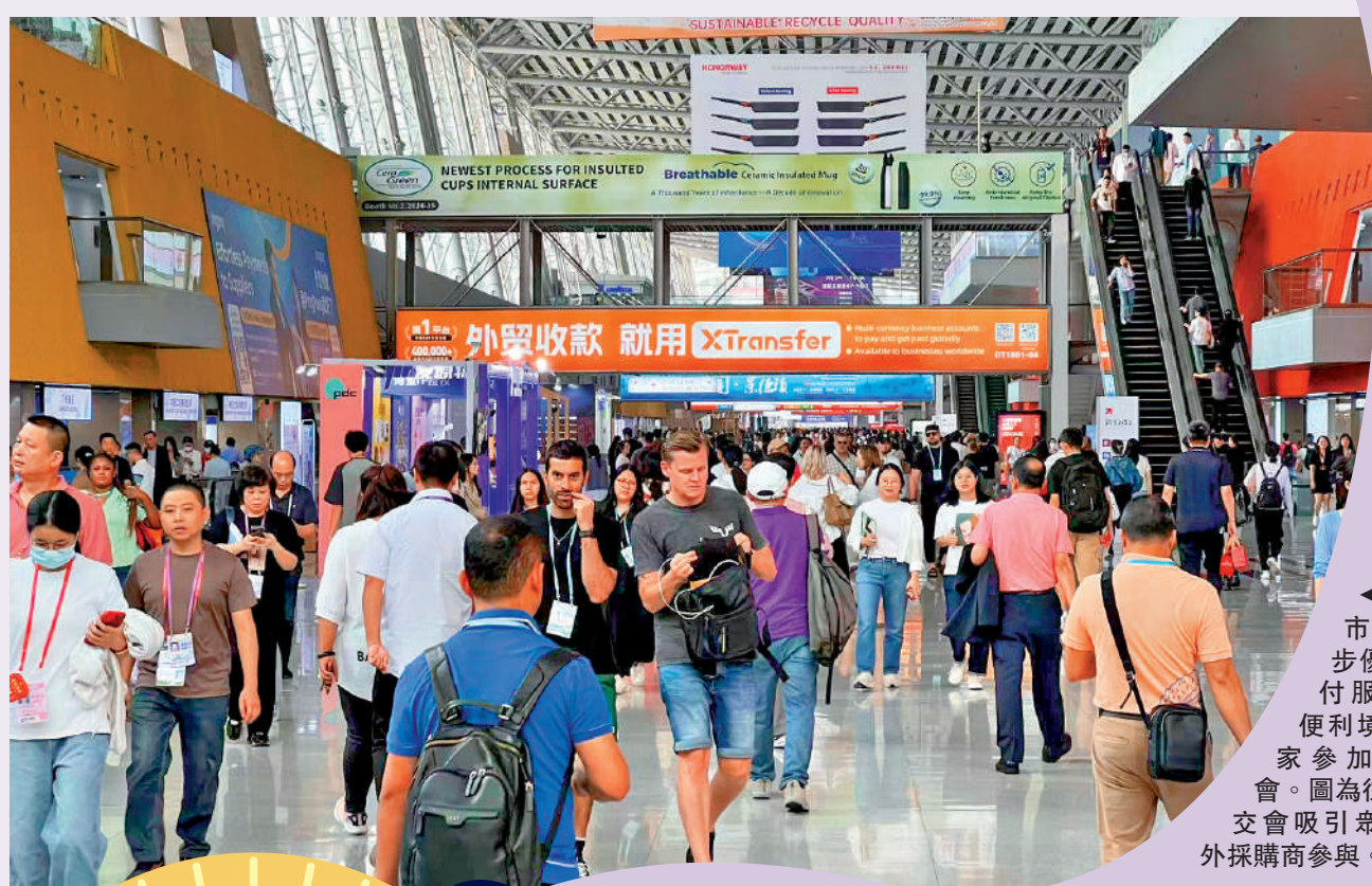
▲廣州市進一步優化支付服務，便利境外商家參加廣交會。圖為往屆廣交會吸引眾多境外採購商參與。