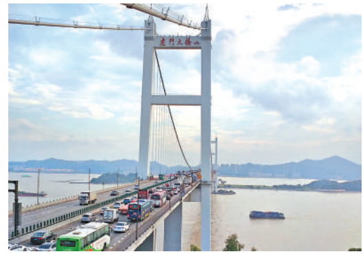
▲虎門大橋擬投資100億元改擴建。圖為虎門大橋行車現狀。

灣區跨珠江口通道群，形成交通「走廊」串起產業「連廊」，助建環珠江口100公里「黃金內灣」。