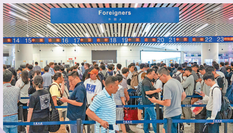
▲廣交會期間，白雲機場將設專道，便利客商入境。圖為廣州白雲機場口岸入境大廳人潮湧湧。

記者了解到，為進一步暢通外籍人員來粵商貿合作、訪問交流、投資創業的通道，白雲邊檢站專設邊檢臨時入境許可辦理區，為符合廣東省外國人144小時過境免簽政策、經白雲機場入境的54個國家外國人提供便利，對持24小時內聯程機票過境白雲機場需離開機場的旅客簽發臨時入境許可，提供「專人專窗、即來即辦」的便利。