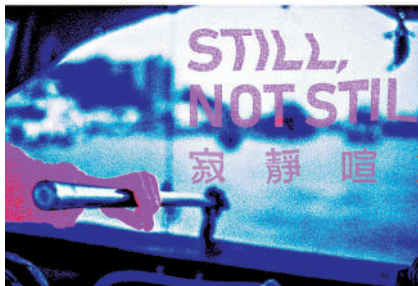
▲跨媒介舞蹈作品《寂靜喧動》將於4月26日至28日在藝發局展藝館舉行。