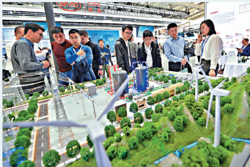
▲中國經濟持續向好，隨着內需恢復，有助帶動增長。