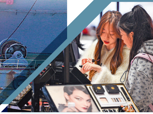
消費者在海南海口的免稅店選購商品。

海南省委副書記、省長劉小明介紹，去年，海南多項經濟社會指標增速處在全國前列，GDP增長9.2%，規上工業增加值增長18.5%，體現自貿港經濟形態的貨物貿易、服務貿易分別增長15.3%、29.6%。自由貿易港建設6年以來，進口原輔料、交通工具及遊艇、自用生產設備三張「零關稅」清單政策，累計進口貨值202億元，減免稅38.1億元；2023年離島免稅購物人次和金額分別同比增長59.9%、25.4%。目前，外資入墾熱度不斷攀高，2018年以來，海南新設外資企業以每年65%的增幅持續增長，已經有6543家。