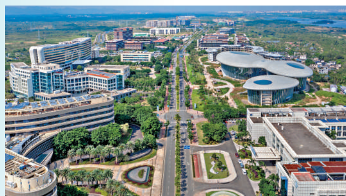
海南博鳌樂城國際醫療旅遊先行區。