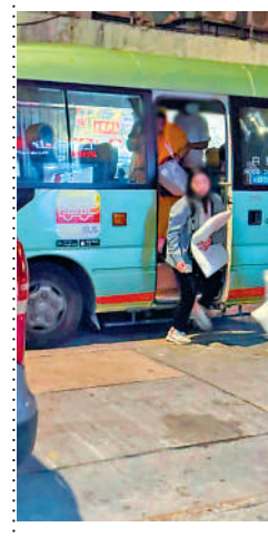
▲華豐大廈部分災民獲安排入住過渡性房屋單位。

佐敦華豐大廈導致5死的三級火，大批住客與市民在火災中疏散逃生，民政及青年事務局表示，截至昨日下午，累計超過530人次到開放作臨時庇護中心的梁顯利油麻地社區中心登記使用，另