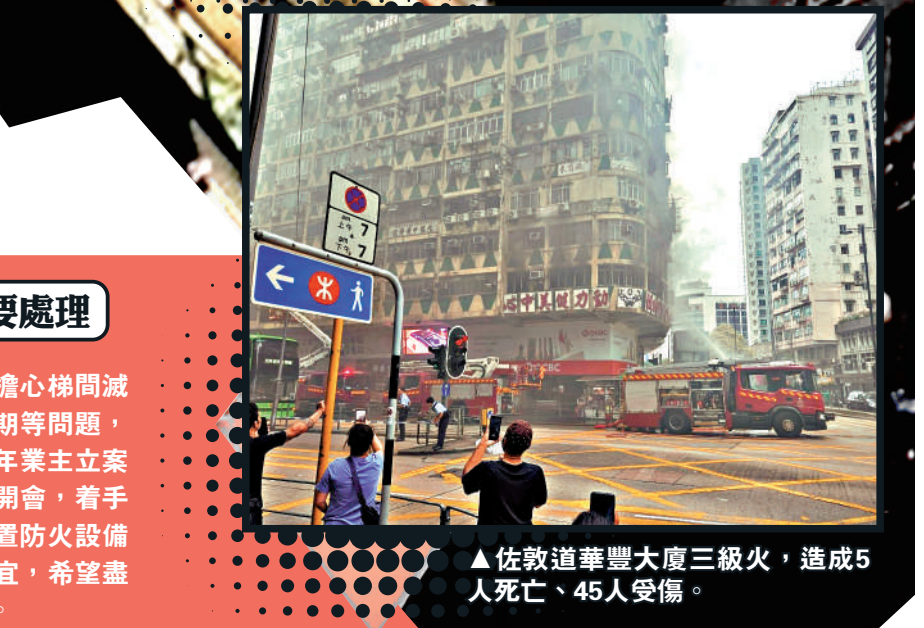
▲佐敦道華豐大廈三級火，造成5人死亡、45人受傷。