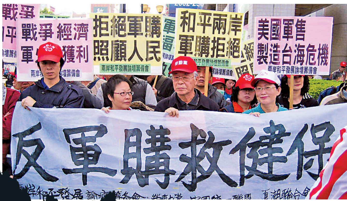
▲台灣民眾舉行集會，批評台當局對台軍售不僅破壞兩岸和平，還擠壓島內民生預算。資料圖片