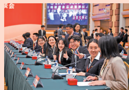
4月9日，馬英九率台灣青年一行參訪北京大學，與北大師生展開座談。

訪北大的交流活動。「兩岸青年『攜手努力』要比『各自努力』更能激發中華民族強大發展潛力。」他說。