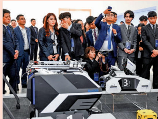
4月1日，台灣青年在深圳市大疆創新科技有限公司參訪。

「我們在大陸工作創業，得到許多照顧和扶持。」他說，在交流中感受到來訪台青有意來大陸發展的熱情，歡迎更多島內年輕人加入「兩岸夢想家」的行列。