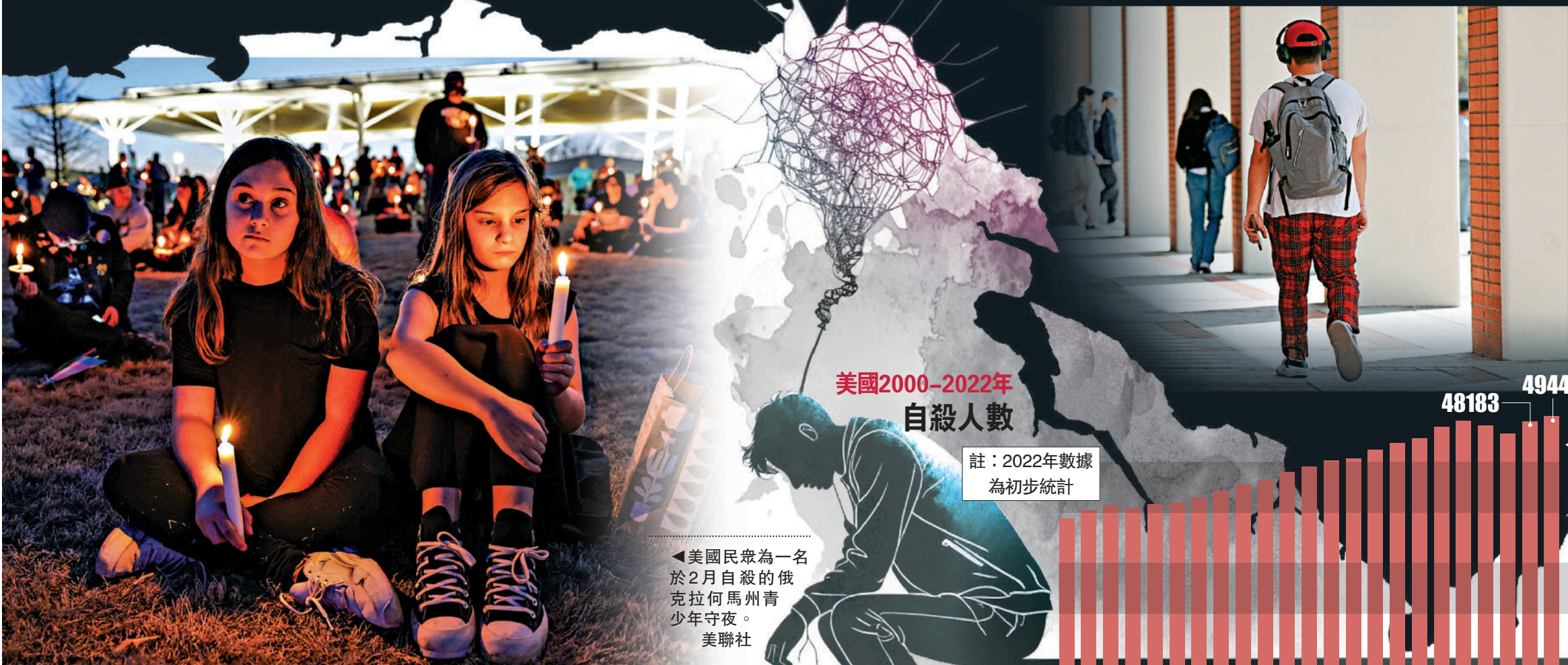
▲美國部分大學出現多起自殺事件。