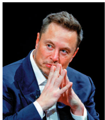
▲特斯拉行政總裁馬斯克。