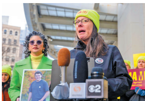
▲3月，一名母親在紐約示威，她的兒子在Facebook上遭受欺凌後自殺身亡。