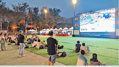
▲不少未有購票入場的球迷在場外的大熒幕觀看賽事。

香港站的參加隊伍集齊世界各地的勁旅，陣容鼎盛，這也令到有限的門票銷量火爆。未能選購到「心水」價位門票的觀眾亦不必為此而擔心，皆因在比賽場館外便有大屏幕實時直擊場內比賽的最新賽況，首日有不少未有購票的觀眾便齊聚大屏幕前觀戰，感受另一種「現場睇波」氣氛。