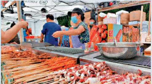
▲場內設有美食區，不少球迷排隊購買。