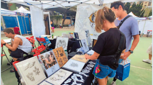
▲兩名入場人士在紋身藝術攤位中參觀。