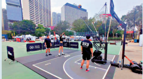
▲有球迷在「3x3 Village」試玩投籃遊戲。

除了激烈的賽事外，賽會還安排了多元化的嘉年華活動「3×3 Village」同步展開。內裏設有城市運動體驗區、符合國際標準的三人籃球場，更有美食攤檔零售攤位、潮流創意文化以及紋身藝術等一系列特色攤位，好動派球迷可試玩投籃遊戲，文靜派亦可暢遊創意文化及紋身藝術區。