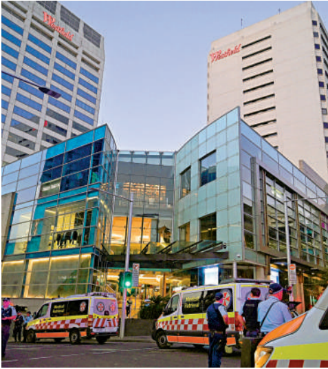
▲救援車輛停在事發商場外。