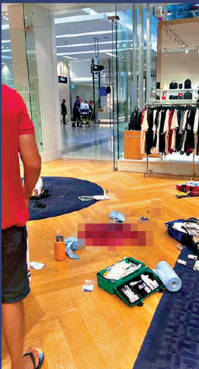
▲商店內的地板上遺留大片血跡。