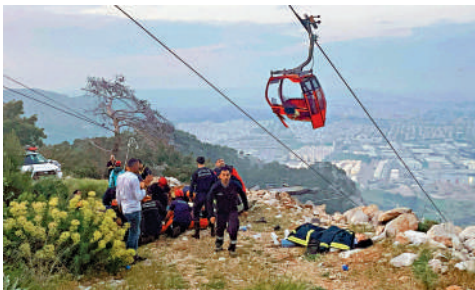
▲救援人員趕到事發現場，發生事故的纜車車廂爆開。