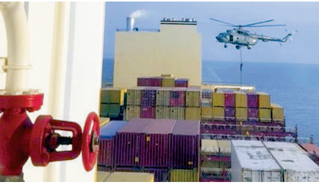
▲伊朗海軍13日在霍爾木茲海峽附近扣押一艘貨船。

參與行動軍艦和軍機的具體數量。該官員說，部署在該地區的其他軍艦，包括「艾森豪威爾」號航母等仍在附近。另一名美國官員稱，美國的行動包括重新部署兩艘驅逐艦，其中一艘已位於該地區，另一艘被重新部署到該地區，至少一艘配備了「宙斯盾」導彈防禦系統。