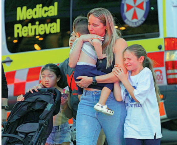
▲商場內的民衆被疏散離開。