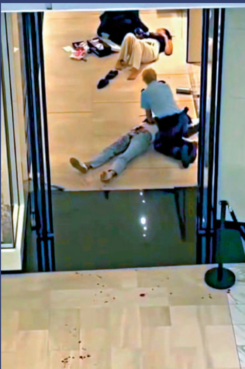
▲多名路人受傷倒地。