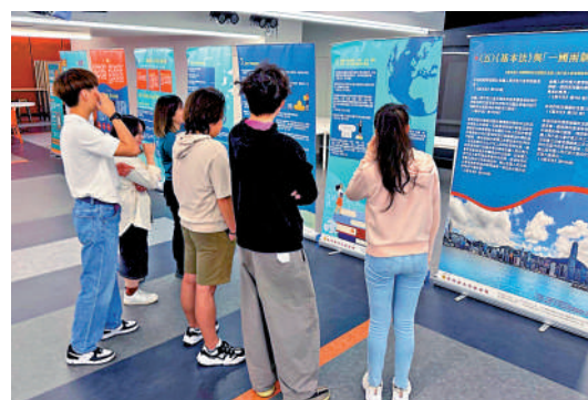
▲樹仁大學與香港基本法基金會合辦展覽。

日後開放予專上院校 現時，團隊已為每個範疇編寫相關的課程 內容，以影片及動畫的形式在平台展示。首批 使用平台的學生表示，學習平台上的多媒體內 容清晰生動，配上日常生活的例子，令他們對 有關範疇有更深入的了解。 據悉，該學習平台的課程內容將會持續更 新，並將於下一階段加入更多互動元素及遊 戲。相關教材將於計劃全面推出後供其他教育 團體免費使用，學習平台亦將開放予其他專 上院校。