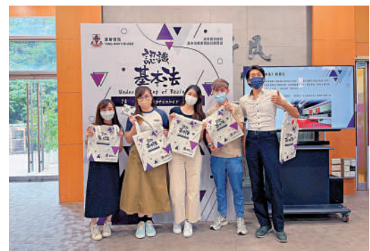
▲東華學院舉辦「認識基本法」活動，加強學生 生認知。

容。 香港樹仁大學已於本年1月向全校學士及研 究生課程學生提供該課程，東華學院亦已於今 年3月以先導形式在校內試行平台，計劃年內正 式推出課程，開放予全校學生使用。兩校學生 將需完成學時15小時學習，測驗成績取得合 格，方可合乎畢業要求。