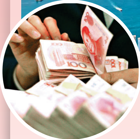
香港需要積極強化離岸人民幣業務的樞紐地位。