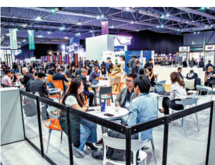
人才是全球所有國際金融中心賴以成功的基本要素之一。

此外，更為簡便的「灣區認證」服務，有助吸引和推動金融科技人才和設備進入香港，為香港的科技金融發展注入更多新血；數字人民幣業務的發展獲