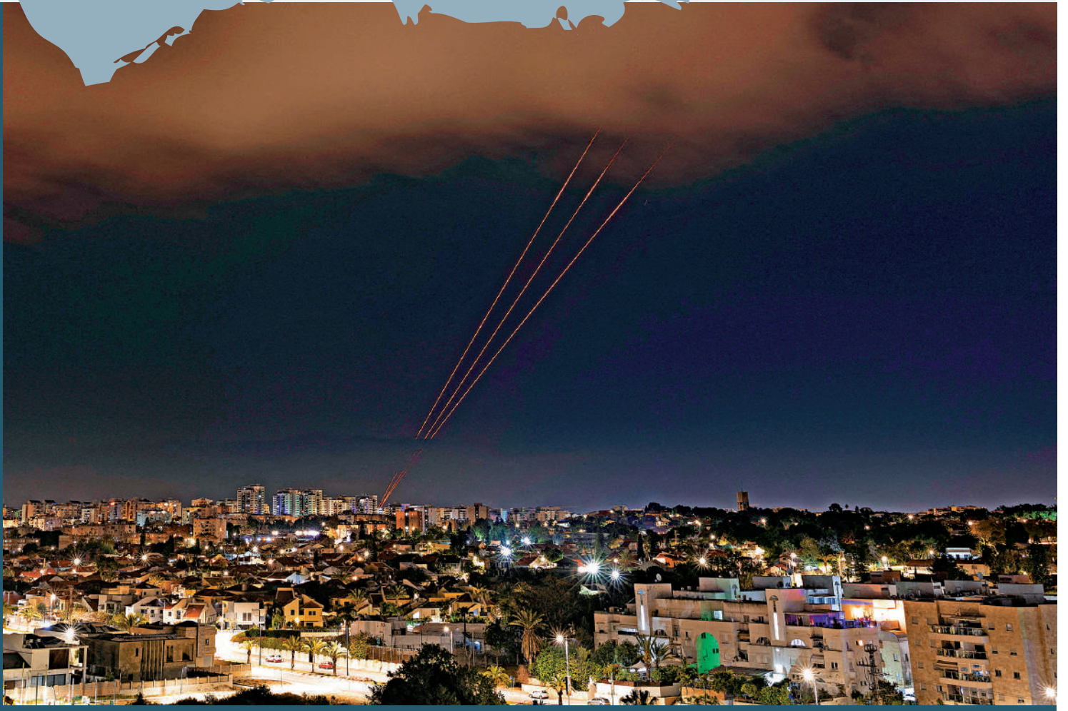
▲ 以色列防空系統14日凌晨攔截伊朗無人機和導彈。