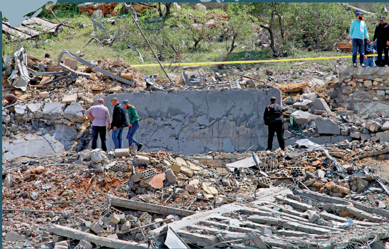
◀以色列空襲摧毀黎巴嫩的一棟建築。