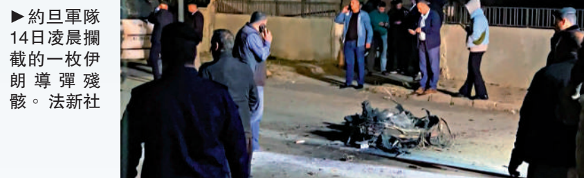
►約旦軍隊14日凌晨攔截的一枚伊朗導彈殘骸。