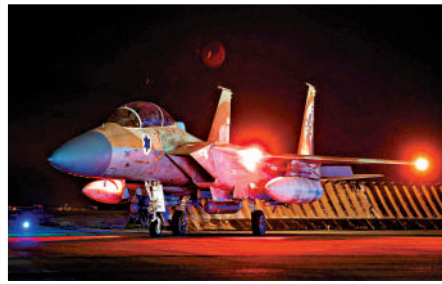
◀14日，以色列空軍基地的F-15鷹式戰機準備執行攔截任務。