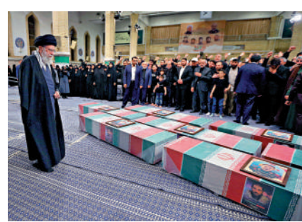
▲4日，伊朗最高領袖哈梅內伊在1日伊朗領事館襲擊中喪生的7名革命衛隊成員的棺材前祈禱。

近年來，以色列開始與伊朗的主要宗教和地區競爭對手沙特阿拉伯建立關係。以色列不斷指責伊朗襲擊船隻；而伊朗則指責以色列進行針對性暗殺，並破壞鈾濃縮工廠。