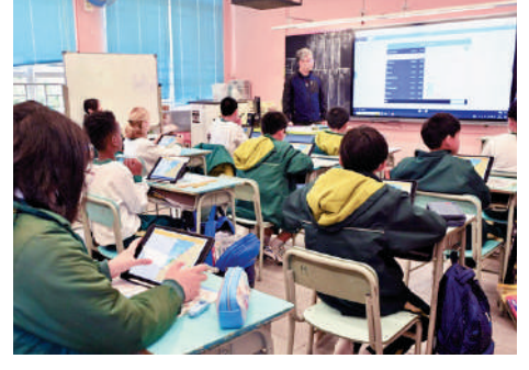
▲梅窩學校寬頻服務提升，教師可靈活安排電子教學，提高學生的學習興趣。