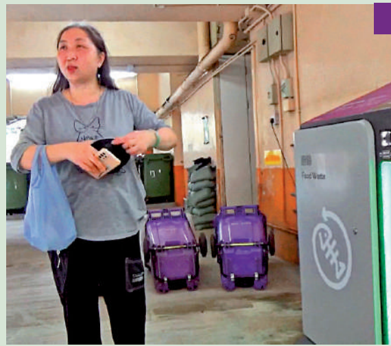
淘大花園 淘大花園分別在2014和2017年參與垃圾收費試驗。住戶莫女士表示，仍未知垃圾將會在收垃圾時放入現時的大垃圾桶，還是派人逐戶上門收集。