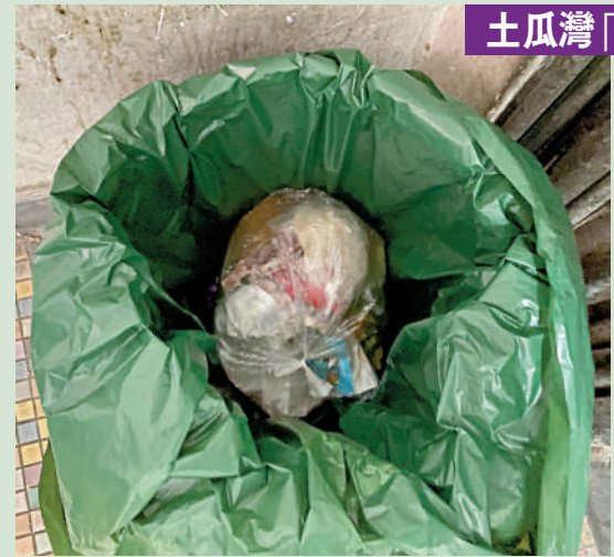
土瓜灣「三無大廈」 大廈是垃圾收費試驗，居民包好垃圾後再放進指定垃圾袋。