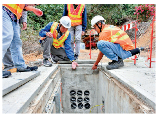
▲目前已有超過160條鄉村透過資助計劃鋪設光纖網絡，工程預計2026年或之前完成，惠及約11萬村民。

【大公報訊】記者黃知行報道：為改善鄉村上網「龜速」情況，政府推出擴展光纖網絡至偏遠地區鄉村資助計劃，改善互聯網基礎設施，讓村民享受穩定的高速寬頻服務。目前已有超過160條鄉村透過資助計劃鋪設光纖網絡，約八萬村民受惠。大澳以前只靠銅線提供基本的電訊服務，上網速度可能跟不上現代人要求。在資助計劃下，大澳部分鄉村和高戶去年年中已經有光纖網絡覆蓋。