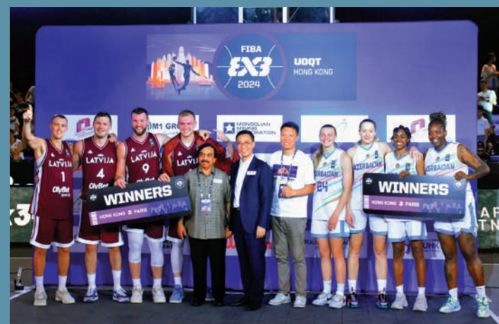
▲楊潤雄（右六）主持頒獎禮。