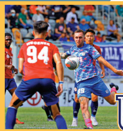
▲傑志的恩查（前右）起腳射門。