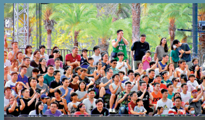
▲現場球迷全力為球員打氣。