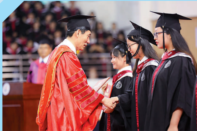
廣州中醫藥大學每年培養大批來自香港的畢業生。