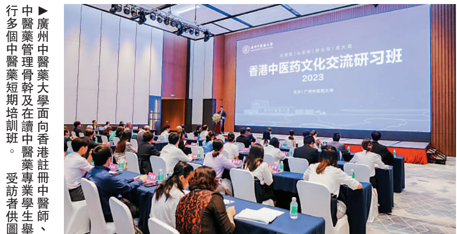
廣州中醫藥大學向香港註冊中醫、中醫藥管理骨幹及在讀中醫藥專業學生舉行多個中醫藥短期培訓班。

香港和廣東的中醫文化同根同源。建校百年的廣州中醫藥大學，從誕生到發展亦與香港息息相關、血脈相連。廣州中醫藥大學的前身廣東中醫藥專門學校成立於1924年9月，早在建校之初，便與香港有着密不可分的聯繫。