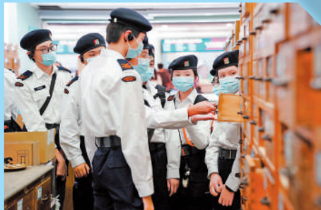
香港醫療輔助隊少年團的學生在廣州中醫藥大學參觀學習。