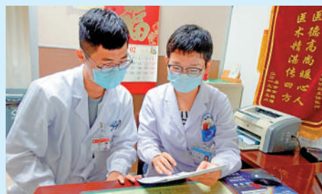
廣州中醫藥大學的老師出診時教導香港學生。