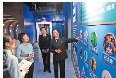
▲蘭州海關工作人員向民眾科普國門生物安全知識。

秘密」披露，中國某稀土公司原副總經理成某在工作中可以接觸到稀土行業內部信息，在結識了境外某有色金屬公司上海子公司員工葉某某後，受巨額報酬誘惑，向其提供中國稀土收儲明細、指令性計劃等信息。2023年11月，葉某某以為境外收買、非法提供國家秘密罪獲刑11年，成某以為境外非法提供國家秘密罪、受賄罪獲刑11年6個月。 大公報記者趙一存