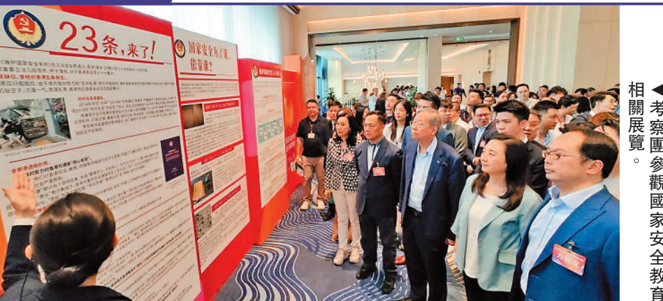
▲考察團參觀國家安全教育相關展覽。