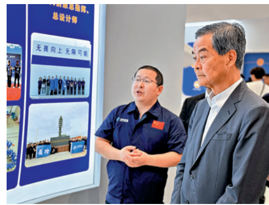
▲梁振英率團調研南沙企業。

當天調研後，梁振英表示，即便已經來過南沙多次，他仍然看到了許多新事物，粵港合作同樣還有巨大空間值得發掘。「香港的作用不是提供一個市場，而是通過香港可以讓內地好的產品走向國際，這就是我們高質量發展『最後一公里』的命題。」他指出，香港要在粵港合作中發揮超級聯繫人的作用，發揮其知識產權、金融業等專業服務業的優勢，幫助內地產品打開更大的市場。比如香港擁有眾多大大小小的外國商會，就可以在其中發揮作用，從產業和經濟合作層面促進國內外的溝通交流和相互了解。