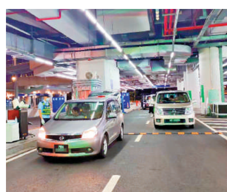
▲港澳車「北上」呈現口岸「周末熱」「節假熱」。圖為港澳車輛通關北上。

對於「北上」熱潮來襲，廣東省公安廳交通管理局提醒廣大「港澳車北上」車主及駕駛人，嚴格遵守相關法律法規，請勿駛出廣東省。其中，根據《廣東省關於香港機動車經港珠澳大橋珠海公路口岸入內地管理辦法》相關規定，通過「港車北上」進入內地的香港機動車僅限在廣東省行政區域行駛，如果超出規定行駛範圍的，除依據法律法規及有關規定依法處理外，1年內不予受理新的申請。