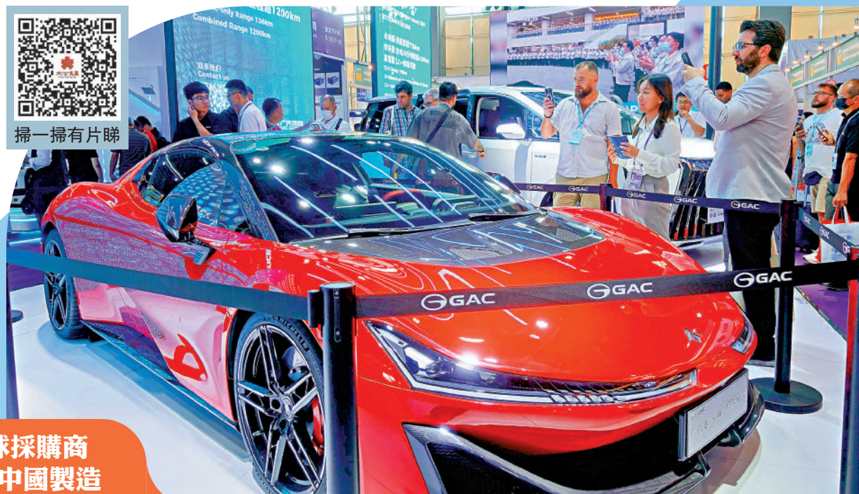
▲廣交會上的新能源汽車展位，成為海外採購商的「打卡點」。圖為廣汽埃安「首秀」的純電超跑昊鉑SSR。