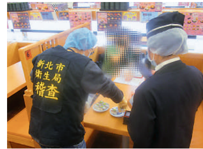
▲新北市衛生局人員到食肆抽檢食品。

【大公報訊】據中通社報道：台灣近期頻繁曝出食品安全問題，當局疾病管制署16日表示，近期全台灣腹瀉就診人次上升，腹瀉群聚事件數創下近四年同期最高，檢出病原體8成為諾羅病毒（港稱：諾如病毒）。 疾管署監測資料顯示，台灣上周腹瀉就診案計13.9萬人次，較前一周上升15.7%，近四周共接獲203起腹瀉群聚通報案件。 腹瀉群聚通報案件發生場所以餐飲、住宿業為主，其中病原體檢出陽性案件計56起，其中8成案件檢出諾羅病毒。疾管署稱，由於諾羅病毒傳染力強，只需少量病毒便可傳播，故容易引發群聚感染，民眾如有腹瀉，應待症狀解除至少48小時以後再恢復上班上學。 據報道，台灣王品集團近期發生食品中毒案，累計155人就醫，病人糞便檢體中檢出諾羅病毒。