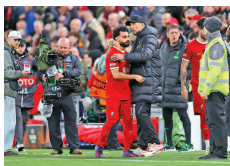
▲沙拿(前左)仍是利物浦最能寄望的射手。