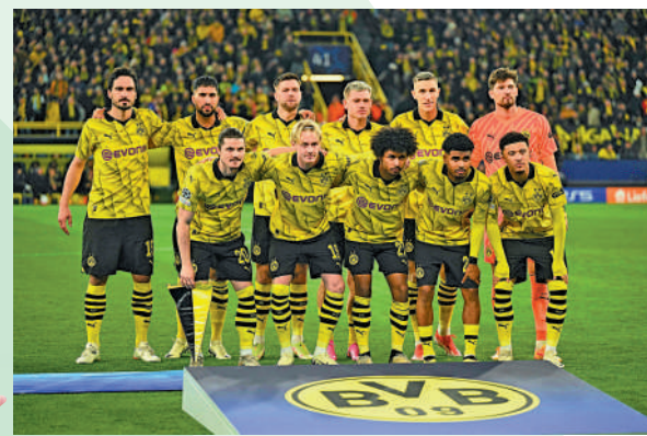
▲多蒙特是歐聯四強稀客。