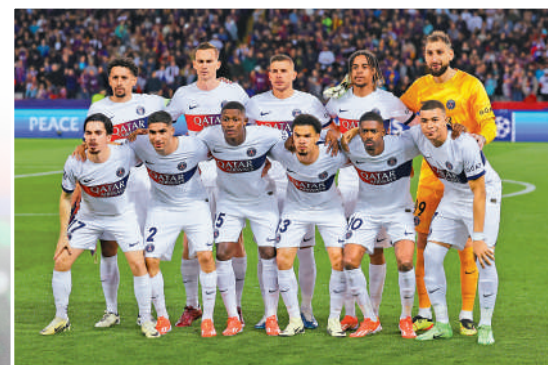
▲聖日耳門不滿於打入準決賽。