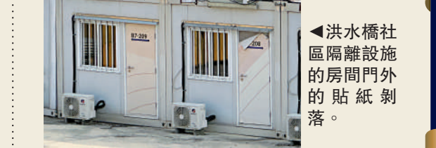
洪水橋社區隔離設施的房間門外的貼紙剝落。