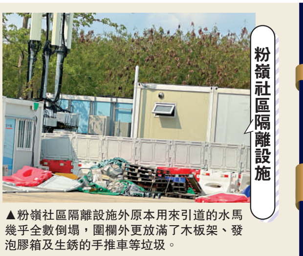
粉嶺社區隔離設施外原本用來引道的水馬幾乎全數倒塌，圍欄外更放滿了木板架、發泡膠箱及生鏽的手推車等垃圾。