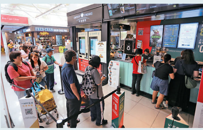
4月21日「全港戲院日」統一30元戲票昨日開售，屯門一間戲院中午一度出現排隊人龍。

全港63間戲院將在今個星期日劃一票價30元，每人每次最多購買四張，各間戲院及網上售票網頁於昨日中午12時公開發售戲票。大公報記者在現場所見，位於屯門新都商場的英皇戲院，中午時段有20至30人排隊，但部分戲院只有數人至十多人排隊，未算太多。