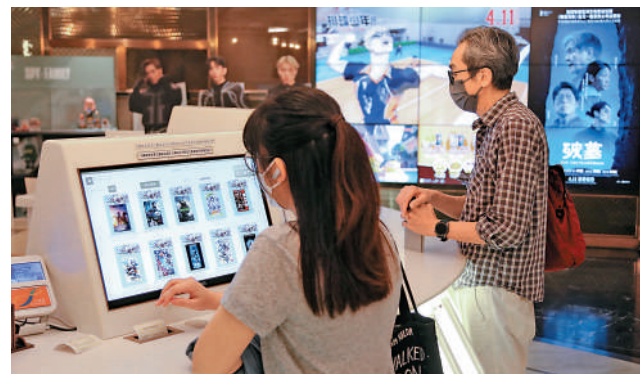
部分市民選擇在自助購票機買戲票。

他又提到，港產片在2024年仍有不少重頭戲，包括即將在5月公映的《九龍城寨之圍城》、已排期在暑假檔期上演的《海關戰線》。