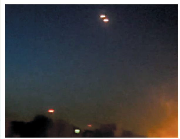
▲► 伊斯法罕地區19日傳出爆炸聲，天空中可見異常閃光。