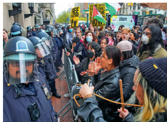
▲支持巴勒斯坦的示威者18日在哥倫比亞大學校門外與紐約警方對峙。

將面臨停學處分。警方表示，被拘捕的示威者面臨「非法侵入」指控，其中兩人還涉嫌妨礙公務。整個過程中未發生暴力或受傷事件。