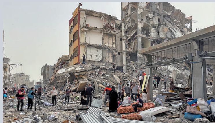
▲加沙巴勒斯坦民眾18日檢查被軍炸毀的居民樓。