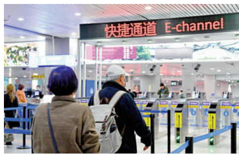
▲在福州長樂國際機場，入境台胞使用快捷通道通關。

國台辦發言人朱鳳蓮2月底曾表示，自2月1日起，M503航線取消自北向南飛行時向西偏置限制。近一個月來，該航線總體運行安全平穩，大陸、港澳地區及國際航空公司平均每天飛行65架次，其中南下航班53架次，北上航班12架次，充分說明該航線的安全性和可靠性。