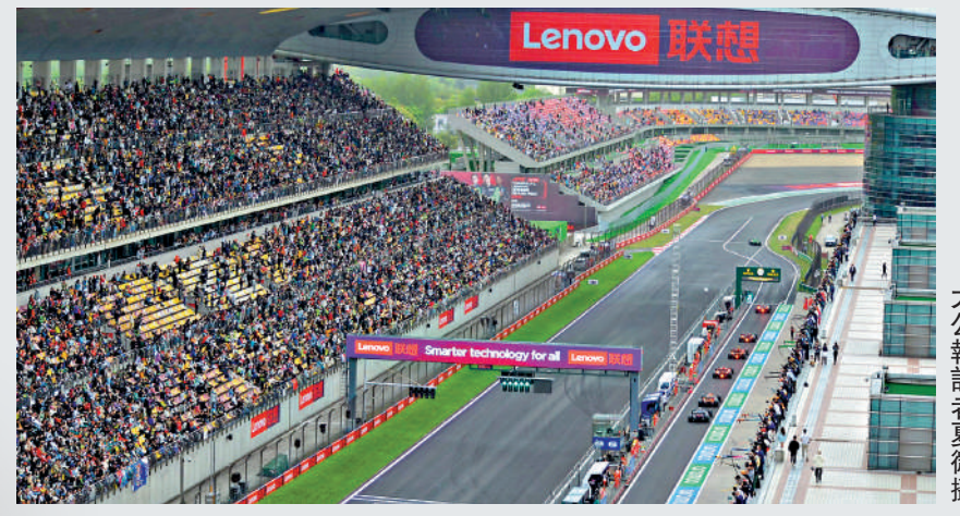
上海國際賽車場昨日人山人海。

4月19日，2024聯想世界一級方程式大賽車（F1）中國站拉開開幕。當天下午的衝刺賽排位賽中，麥拿命車隊的諾里士以1分57秒940的成績奪得桿位，中國車手周冠宇在實力與運氣的雙重加持下成功躋身前10，以2分03秒537排在第10位。