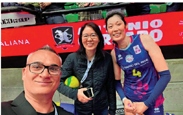
郎平（右二）與朱婷（右一）合照。