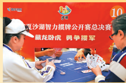
▲攆蛋已經發展至具規模的公開賽賽事。

攆蛋是以兩副撲克牌為競賽工具，四人參與、兩兩結對，以輸贏升級的方式進行的智力項目。「攆」意即扔、摔，「蛋」即「炸彈」。「扔炸彈」被認為能夠體現出牌者的水準和性格，再加上「貢牌」「還牌」「紅桃配」等特色玩法，頗具趣味性。據不完全統計，目前中國攆蛋玩家已超1.4億人。而根據首屆全球攆蛋推廣峰會提供的數據顯示，很多華人、華僑團體也熱捧攆蛋，還成立了攆蛋協會，覆蓋人口約7億。