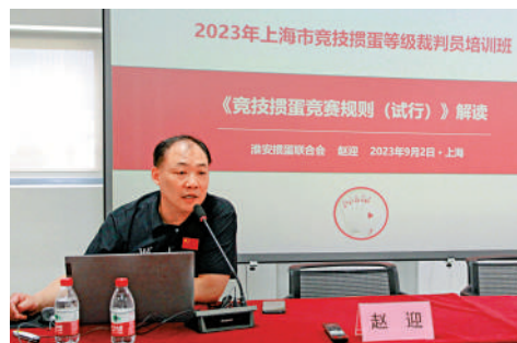
▲攆蛋已經按照棋牌類競賽項目，進行正規化管理。

攆蛋走紅同時也朝着競技體育邁進。近兩年來，各省市陸續成立攆蛋協會，按照棋牌類正式競賽項目進行正規化管理，開展大小賽事。今年1月以來，中國職工競技攆蛋錦標賽、2023年全國撲克牌（攆蛋）公開賽總決賽、全國老年人攆蛋大賽等接連開展。國家體育總局亦在去年出台《競技攆蛋競賽規則》等，對攆蛋進行規範和引導。同年，攆蛋還被列為第五屆全國智力運動會表演項目。