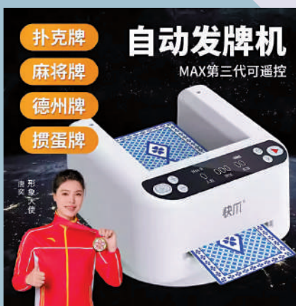
自動發牌機成為網上其中一款熱賣產品。

在北京海淀區上地街道的一家茶樓，每個包間配備攆蛋設備，「喝茶+攆蛋」的運營模式令客流量明顯增加。茶樓服務員表示：「我們樓上樓下一共有16個包間，去年以前經常坐不滿，現在幾乎天天爆滿，電話預定的人幾乎都是來攆蛋的，相應的，我們的茶葉銷量也好了起來。」