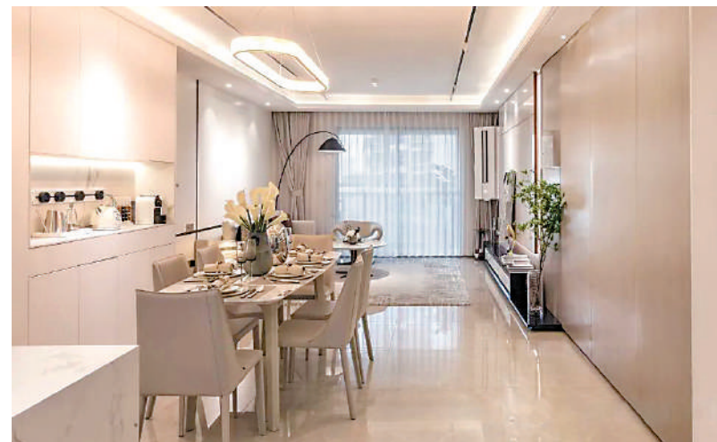
▲中鼎君和名城·珺合府單位方正實用，布局富時尚感。