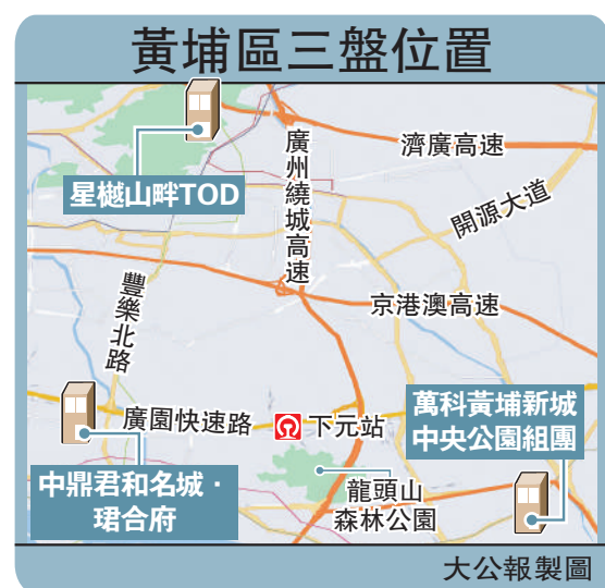
黃埔區三盤位置 大公報製圖

值得一提的是，屋苑配備專業物業管理團隊，提供高標準的24小時貼心管家服務，全天候保安定點巡邏，設置智能門禁，充分保證業主日常生活