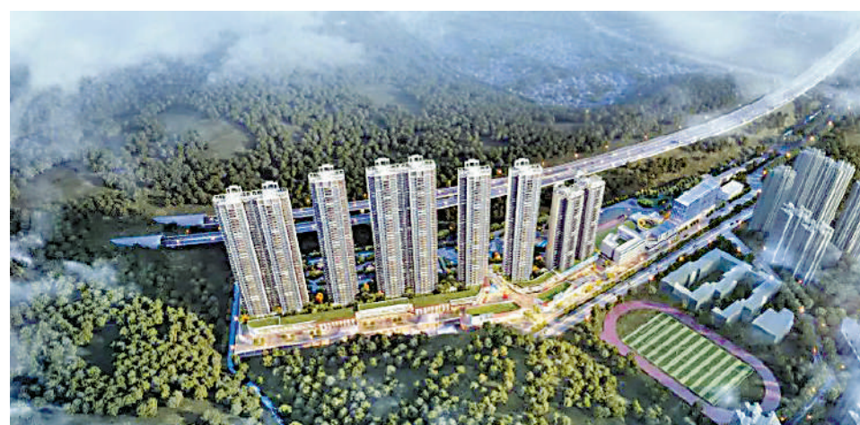
▲星樾山畔TOD以一字型排開，抬高10米，盡覽優美景觀。