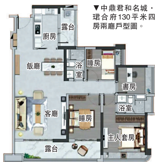
▼中鼎君和名城·珺合府130平米四房兩廳戶型圖。