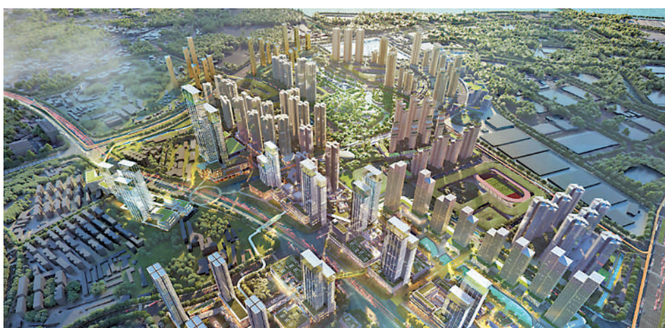
▲萬科黃埔新城為大型舊改項目，最新推出的中央公園組團，與公園為鄰。