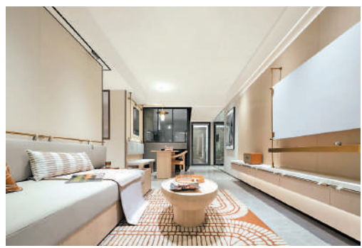
▲萬科黃埔新城中央公園組團主打三房戶。

主推的88平米戶型，玄關有超大收納空間，客廳闊約3.5米，與開放式廚房構成更廣闊空間。最大的142平米為四房+一房兩廳戶型，橫廳設計，客廳闊6.3米，南北對流，戶型的一房可根據住戶需要改造成書房，又或打通與大廳相連，主人套房擁有270度全景大窗台和衣帽間，視野廣闊。