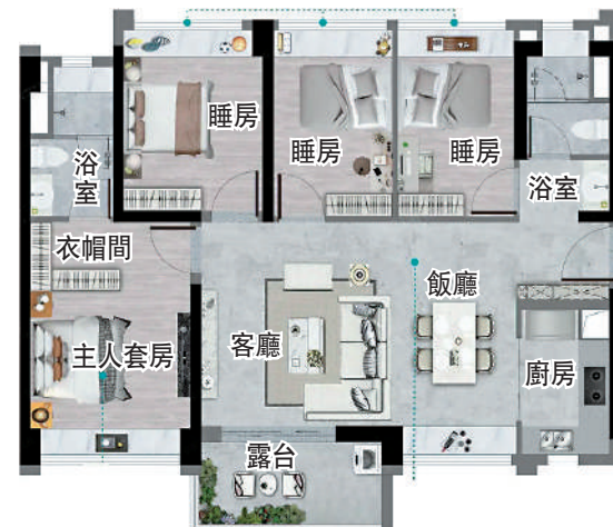
▲星樾山畔TOD面積一百一十平米四房兩廳戶型圖。