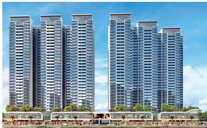
▲中鼎君和名城·珺合府二期共1190伙，南北朝向，採光充足。