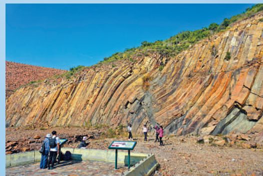
由淺色火山岩組成的六角形岩柱，是萬宜水庫的奇觀。

若是走累了，不妨前往聽鳴茶座飲茶小憩，這是香港首間由聽障人士經營的餐廳。餐廳外圍精心種植了山茶花、滿天星等植物。不妨點一杯咖啡，一邊休息一邊感受林間的陣陣微風，度過愜意時光。