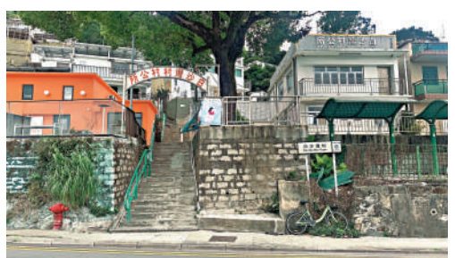
▲依山而建的白沙灣村。