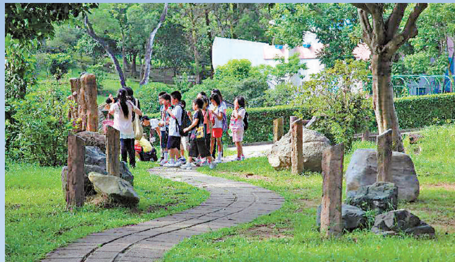
沿着岩石學園的步道，訪客可親身以觸覺與視覺感受香港岩石的特質。

來到岩石學園，在這條步道上可以近距離欣賞兩排大型岩石標本。這是香港首個展出28個大型本地岩石標本的戶外展覽場地，展示香港主要