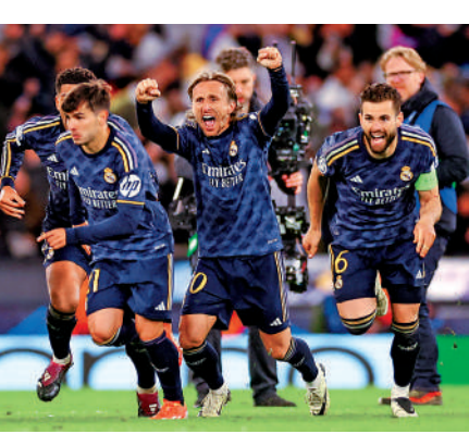
▲皇馬剛打敗曼聯士氣大振。