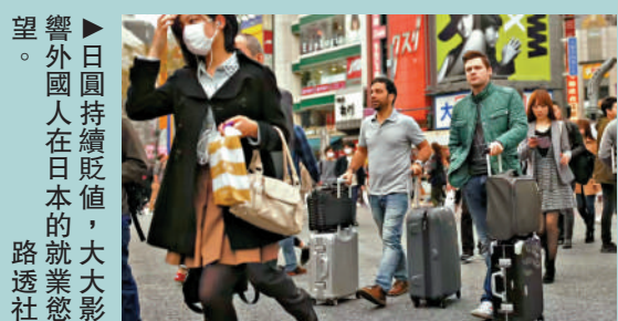
望響：外國人在日本的就業慾望。日圓持續貶值，對日本經濟前景，大透社

另外，當要選擇工作地點時，回答重視「人際關係良好程度」的比例上升至44.3%，比上次調查增加了27.6個百分點。分析認為，不只是薪資水平，對於外國人來說，包含人際關係在內的職場環境，已經成為選擇工作地點時的重要因素。