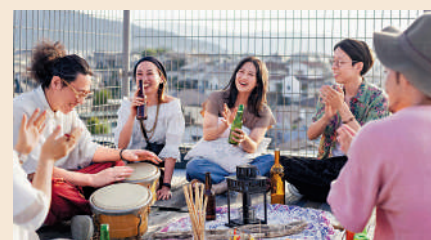
▲日本年輕人更加重視和家人朋友團聚的時間。 網絡圖片

工轉向全職工作，但非全職勞工人數在2023年仍增至2124萬人，比2013年多218萬人，主要是年長者超過傳統退休年齡還在工作。2023年，65歲以上希望維持彈性工作時間的有145萬人，比2013年多了89萬人。