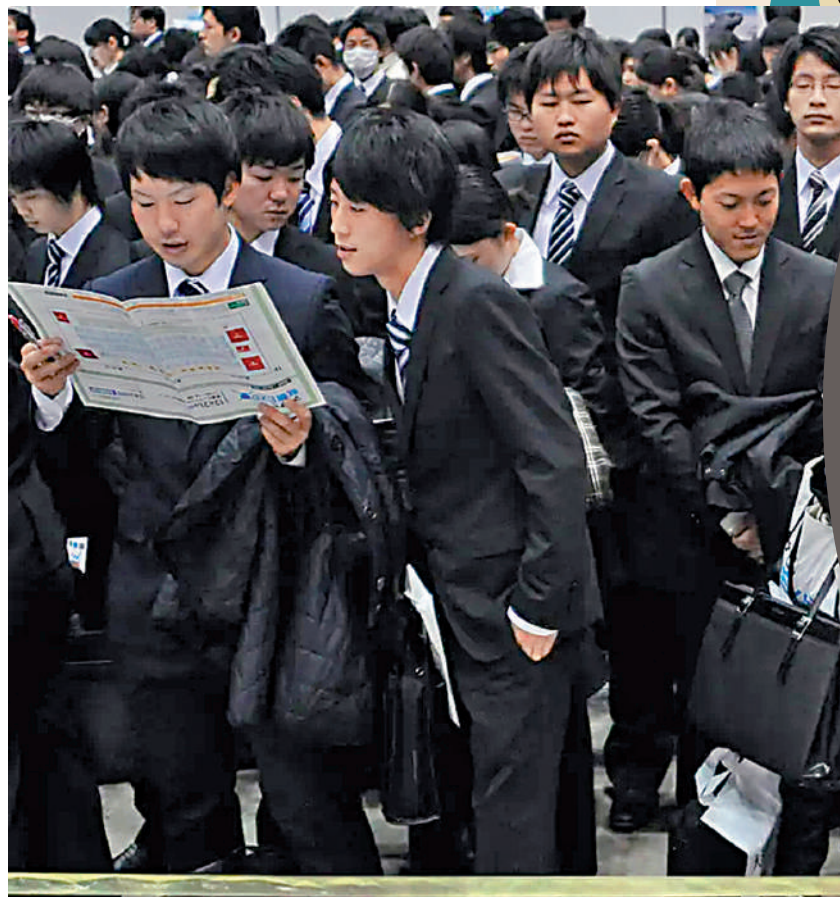
▲日本大學生在東京參加招聘會。

日圓兌美元匯率4月15日下跌至1美元兌154.45日圓，創34年來新低。日本厚生勞動省4月8日發布的今年2月數據顯示，計入物價變動因素後的人均實際工資已連續23個月下降。在這樣的大環境下，日本年輕人對日本經濟的前景感到悲觀，紛紛抓住機會出國工作，日本勞動力短缺危機進一步加劇。