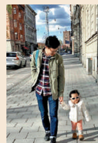
▲該男子前往瑞典工作後，有更多時間陪伴女兒。

2020年2月，他從日本一家汽車公司跳槽到瑞典一家初創企業，年薪增加到上一份工作的1.5倍。工作日在下午6點下班，與妻子和女兒一起吃晚飯，飯後也有更多時間陪女兒玩。