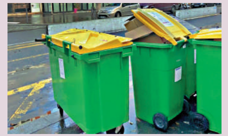
▲法國巴黎黃色蓋子回收紙皮、塑膠、金屬等。

為，香港居住人口密度高，市民若違規亂掉垃圾，清潔人員難以執法，而且應先做好學生的環保意識培育、回收配套安排，「我覺得這兩樣香港都差一點。」 法國垃圾處理 政策背景： 2012年起徵收「垃圾稅」，全國有逾200個市鎮實施有關制度 垃圾稅： 「垃圾稅」包含在地產稅內同時繳，垃圾愈少，所繳費用就愈少 三種垃圾桶： 不同地區略有不同，以巴黎為例，分黃色（紙皮、塑膠、金屬等）、啡色或綠色（非回收垃圾包括廚餘）、白色（玻璃） 電器回收：舊電子設備可以帶到回收中心 大型垃圾：上網預訂時間，清潔部門將派車來清運，或送到銷售家電的大型超市回收 舉報/監察方法：若亂投回收箱，會被清潔工人「原箱拒收」，若果不斷重複犯錯，有機會被罰款