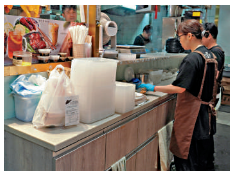
▲銅鑼灣一間燒臘店已轉用非塑膠餐具，負責人指成本貴了一倍。