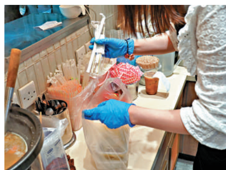
▲銅鑼灣一間冰室的負責人表示，22日起會轉用紙質飲管。