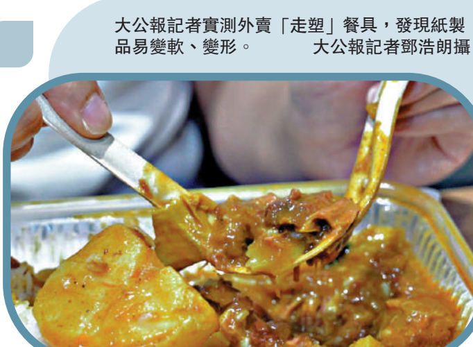
紙匙浸泡醬汁變軟