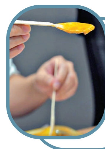
偏平軟木匙難飲湯

謝展寰指出，管制目的是希望建立「走塑」文化，移風易俗，並非懲罰商戶，業界需要時間調整業務配合管制，政府會盡力提供適切的協助，盡量以教育為先、人性化地按個別情況處理個案。