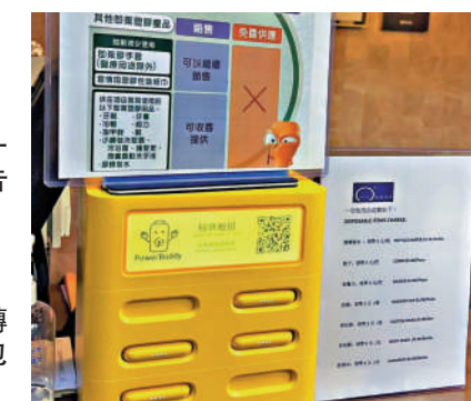
供洗漱用品，才考慮購入合適的替代品。

首階段管制的即棄塑膠產品包括充氣打氣棒、熒光棒、氣球棒和派對帽，大公報記者以顧客身份詢問多間位於太子、深水埗和觀塘的派對房，他們表示只租場地，不提供受管制的派對用品，客人可自備。有專做小朋友生日派對的店舖表示，只會提供紙質派對帽。