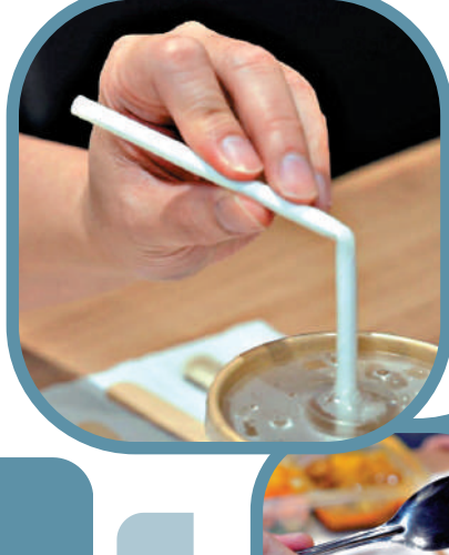
紙飲管久浸易彎曲