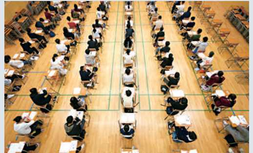
考評局表示，如DSE考試當日遇上惡劣天氣，會因應情況作出特別安排。

至於考試進行期間，如天文台發出熱帶氣旋警告信號或暴雨警告，除非試場主任認為情況危險，否則考試應繼續進行，並依照原定時間完卷。