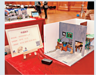
初中歷史科電子閱讀獎勵計劃分享會上展示上屆得獎作品。

載），並使用網上登記平台報名（history-reading-award.iclass.hk）。比賽詳情請瀏覽獎勵計劃專頁。