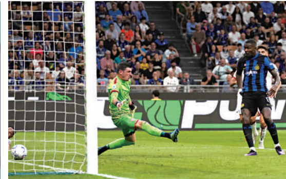
▲國米前鋒馬古斯杜林（前右）本屆表現出色。