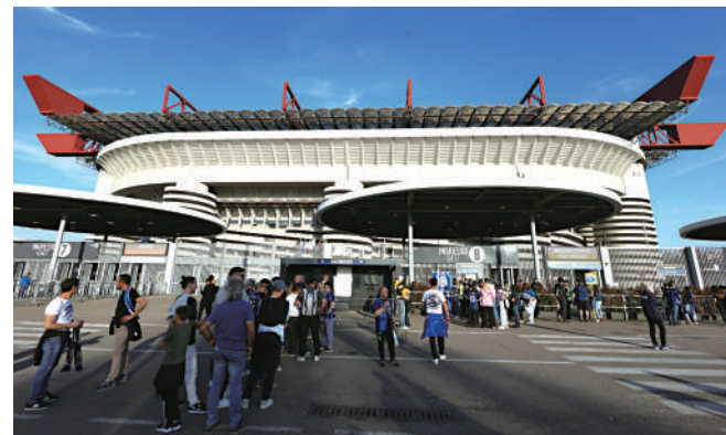
▲「米蘭打吡戰」將在聖西路球場上演。

球員時代曾協助拉素拿過意甲冠軍的恩沙基，目前與國米的合約至2025年屆滿，一般預期他會續約兩年，不過據知他已獲不止一家英超球會青睞，而英超利物浦、德甲拜耳慕尼黑和西甲巴塞隆納幾間豪門來季篤定易帥，國米奪標後他大可「功成身退」。然而，國米已獲明年夏天擴大規模的世界冠軍球會盃資格，恩沙基有意參與，而他上任之初會方就以重金將阿舒拉夫和盧卡古兩主力賣走，如今留隊的話就要會方承諾今夏不會將拿達路馬天尼斯和尼高路巴列拿賣走，相信若國米符合要求，恩沙基來季就會繼續領軍。