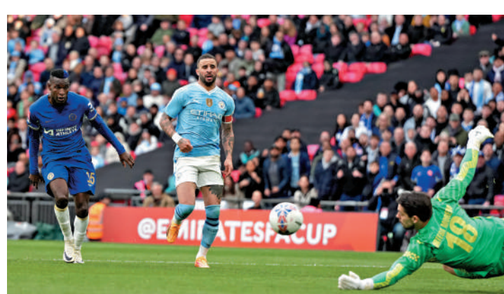
▲積遜（左）射門乏力，被曼城門將奧迪加撲出。