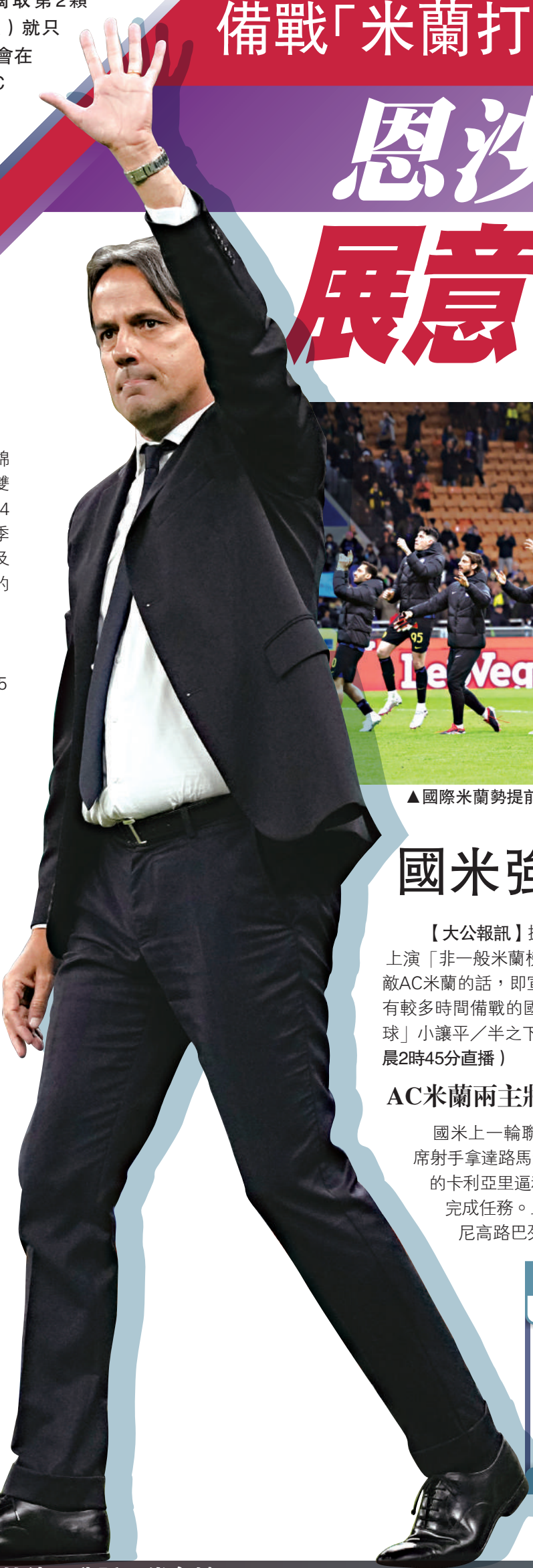
▶國際米蘭主帥施蒙尼恩沙基。