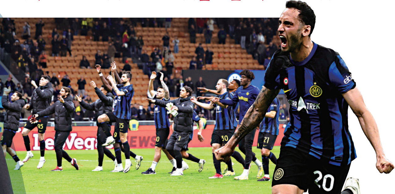
▲國際米蘭勢提前奪得意甲錦標。