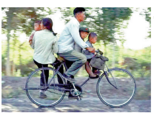
▲「上世紀八九十年代，二八」自行車常承載一家人。

任何現實的思考或批判總以一定的觀念或價值為立足點。在本書中，作者立足的是包括中國人的宇宙觀、人生觀在內的文化體系。本書的思考主題是「人」與「物」的關係，作者提出，「東方人對天下萬物抱有很深的感恩的情懷，物在俗事上與人交往，而不是純粹地被拿來使用。」他認為，中國人的心靈從來沒有把物僅僅當作一個簡單的工具，把人和物割