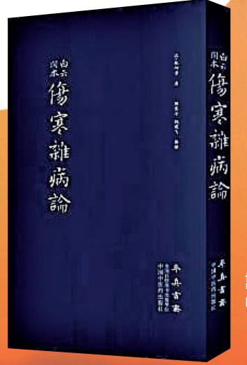
▲白雲閣本《傷寒雜病論》，張仲景著，中國中醫藥出版社。