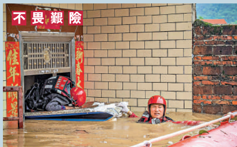
21日，在廣東清遠，救災人員在齊肩的水中被困群眾從屋內轉移。