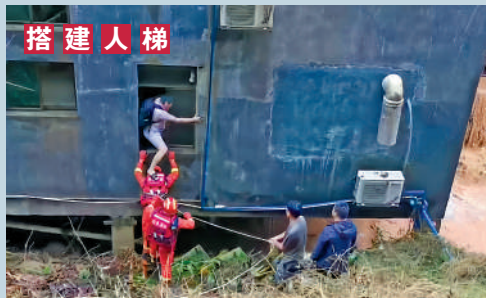
20日，消防救災人員以肩為梯、以背為橋，在韶關一水電站營救被困群眾。