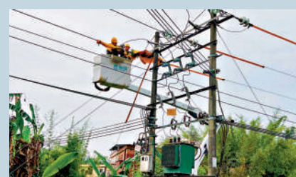
南方電網工作人員正在對受損電網進行搶修。

突擊隊隊員告訴記者，22日上午已將一批應急發電車、發電機、搶修設備及生活物資等送達受災一線，並在江灣鎮山體垮塌救援現場投入6台「災情勘察無人機」。截至22日下午，江灣鎮約1200戶恢復供電，韶關市武江區江灣中學等臨時安置點也已復電，並為300多名救災人員進駐等提供了電力保障。其他援助搶修人員也陸續到位，準備展開大規模搶修。 大公報記者方俊明