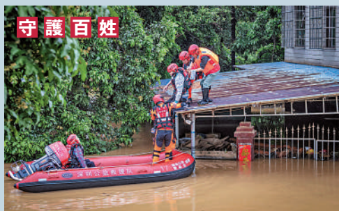
21日，多名救災人員在廣東清遠一個屋頂營救被困群眾。