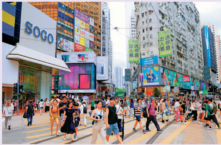
有二三間，為四年半新低。