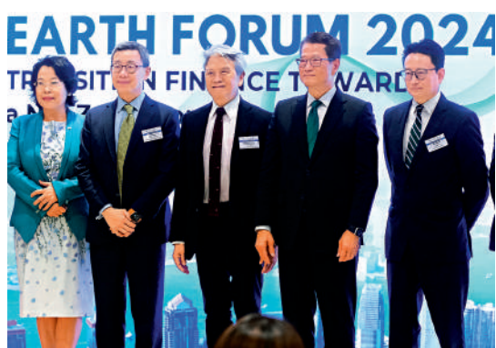
▲陳茂波（右二）表示，本港將推出本地綠色分類框架。

陳茂波指出，為提高金融市場的透明度，並保持綠色和轉型投資的決策一致，以避免發生「漂綠」和「粉飾轉型」（transition-washing）的情況，金管局正制定一項本地綠色分類框架，該框架將適用於內地和歐盟使用的通用分類標準，將很快發布。