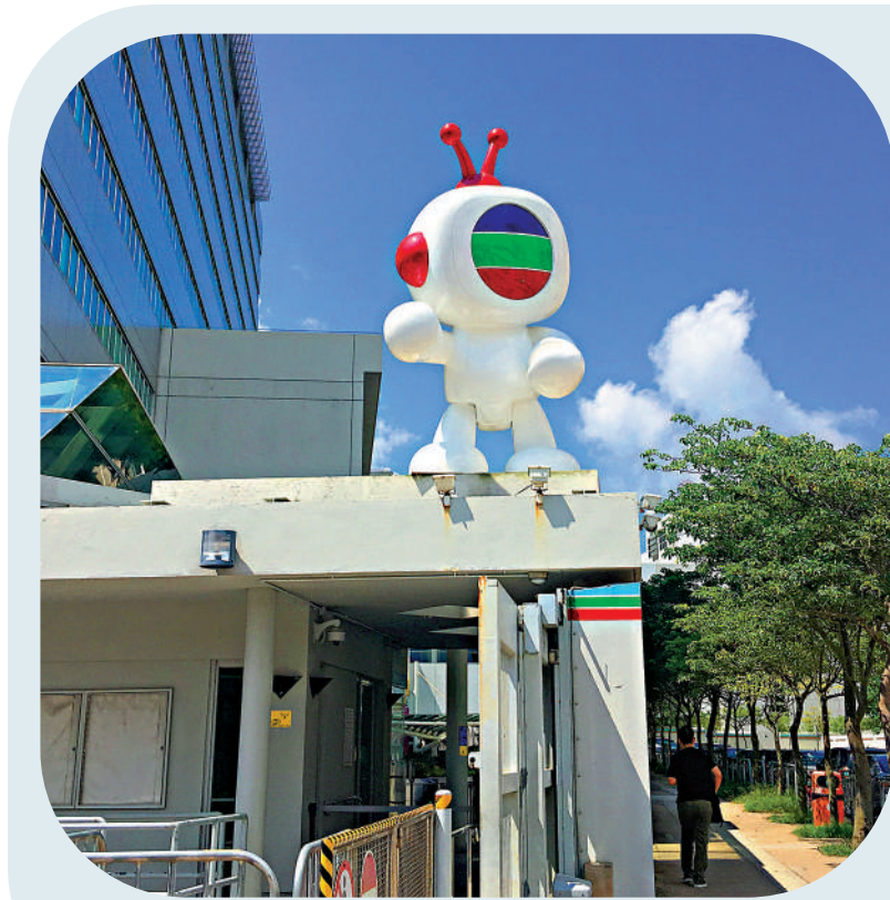
▲電視廣播披露今年首季營運數據，預告下半年將會賺錢。

電視廣播昨日開市觸及3.28元高位，抽升11.2%，隨後升幅緩和，收市仍升6.4%，報3.14元。