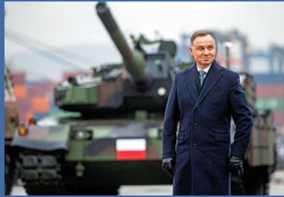
◀波蘭總統杜達22日聲稱，波蘭準備好接收北約的核武器。資料圖片