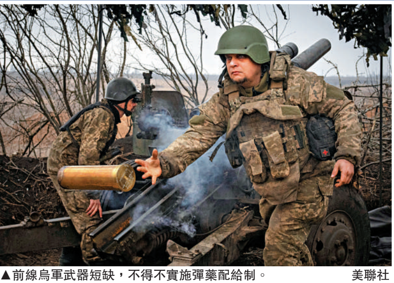
▲前線烏軍武器短缺，不得不實施彈藥配給制。

瑞典斯德哥爾摩國際和平研究所21日發布的最新報告顯示，戰爭和緊張局勢促使全球各個地區增加軍費開支，2023年全球軍費支出高達2.4萬億美元，同比增長6.8%，為2009年以來最大增幅。受俄烏衝突和巴以衝突影響，歐洲、中東和亞洲增幅尤為顯著，其中俄烏軍費分別增長了24%和51%，波蘭軍費激增75%。