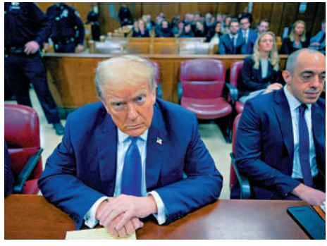
▲特朗普「封口費」案22日進行開庭陳詞。

美媒21日披露，特朗普僅在今年3月就花費了490萬美元的訴訟費用，高昂開支令其陷入資金短缺的困境。特朗普一直通過「拯救美國」政治行動委員會支付訴訟費用，但目前該組織用來支付相關費用的賬戶中僅剩680萬美元。自去年1月以來，該組織已支付了超過6200萬美元的訴訟費。特朗普可能會尋求從捐助者那裏獲得更多資金，要求共和黨全國委員會承擔費用，或者「自掏腰包」打官司。