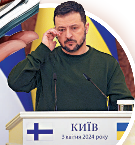
▲澤連斯基呼籲美國盡快向烏克蘭提供新一批軍援。