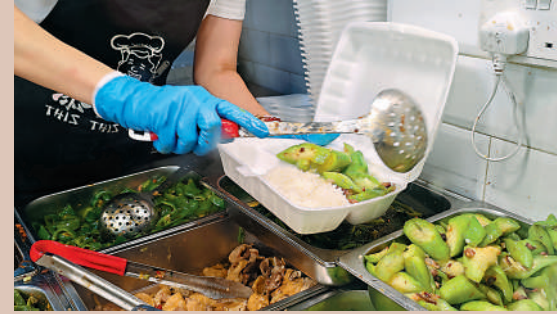
▲發泡膠由於易碎，對環境的破壞最大，因此在新法例下不可銷售或提供。