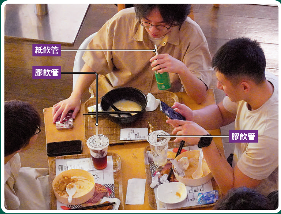
▲首階段管制即棄塑膠產品昨日起實施，由於有半年適應期，所以部分食肆仍提供膠飲管等塑膠餐具。