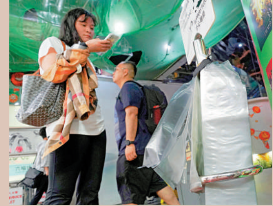
▲有商場昨日仍提供雨傘袋，由於現時是適應期，所以並不算違例。