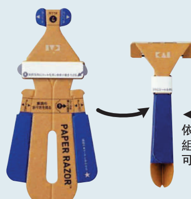
▲使用者只需依照壓線進行組裝摺疊即可。