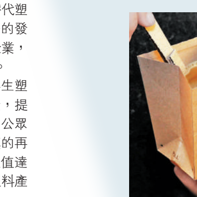
▲該設計將咖啡杯、攪拌棒和外賣袋融於一體。