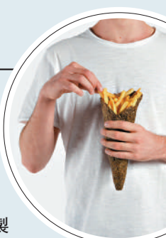
▲包裝材料完全由生產廢料製成，100%可生物降解。