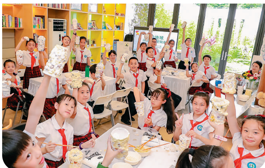
▲深圳舉辦「空杯減塑」行動迎接第55個世界地球日。圖為深圳同學們參與減塑換新手工創作互動，設計環保杯。